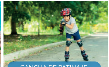
CANCHA DE PATINAJE